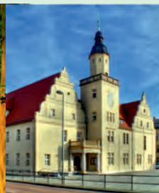
Wörlitz - Schloss im Park