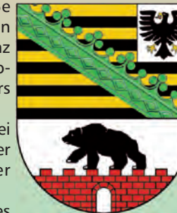
Wappen des Landes Sachsen-Anhalt

Immer hat die Region über Jahrhunderte von Neuankömmlingen profitiert. Ob Flamen, Hugenotten oder Menschen jüdischen Glaubens, sie alle haben unser Anhalt-Land in der Vergangenheit bereichert. Schließlich hat Toleranz nicht erst seit der aufgeklärten Politik des Fürsten Franz Tradition in Anhalt.