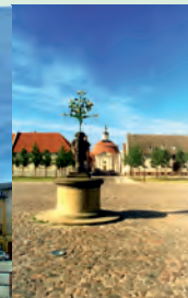
Coswig (Anh.) - Rathaus