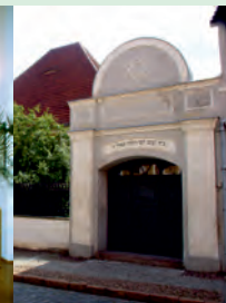
Zerbst - Katharina-Museum