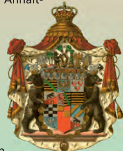
Wappen des Herzogtums Anhalt

Mit der Wiedervereinigung 1990 wurde das Land Sachsen-Anhalt in leicht veränderten Grenzen wieder errichtet.