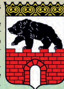
Wappen des Freistaates Anhalt

Der Anhaltische Heimatbund e.V. ist gemeinnützig tätig und engagiert sich für die Pflege des Brauchtums, Umwelt- und Naturschutz, Denkmalpflege sowie die Anlage und Erhaltung von gemeinnützigen Einrichtungen.