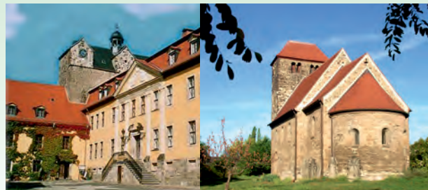
Ballenstedt - Schloss

Der Anhaltische Heimatbund e.V. ist ein gemeinnütziger, eingetragener Verein. Die Arbeit des Anhaltischen Heimatbundes e.V. gilt als kulturell wertvoll und wurde als förderwürdig anerkannt. Mitgliedsbeiträge und Spenden können daher steuerlich abgesetzt werden.