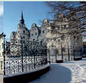
Köthen - Rathaus