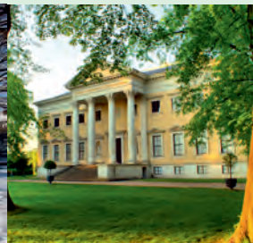
Dessau - Schloss (Johannbau)