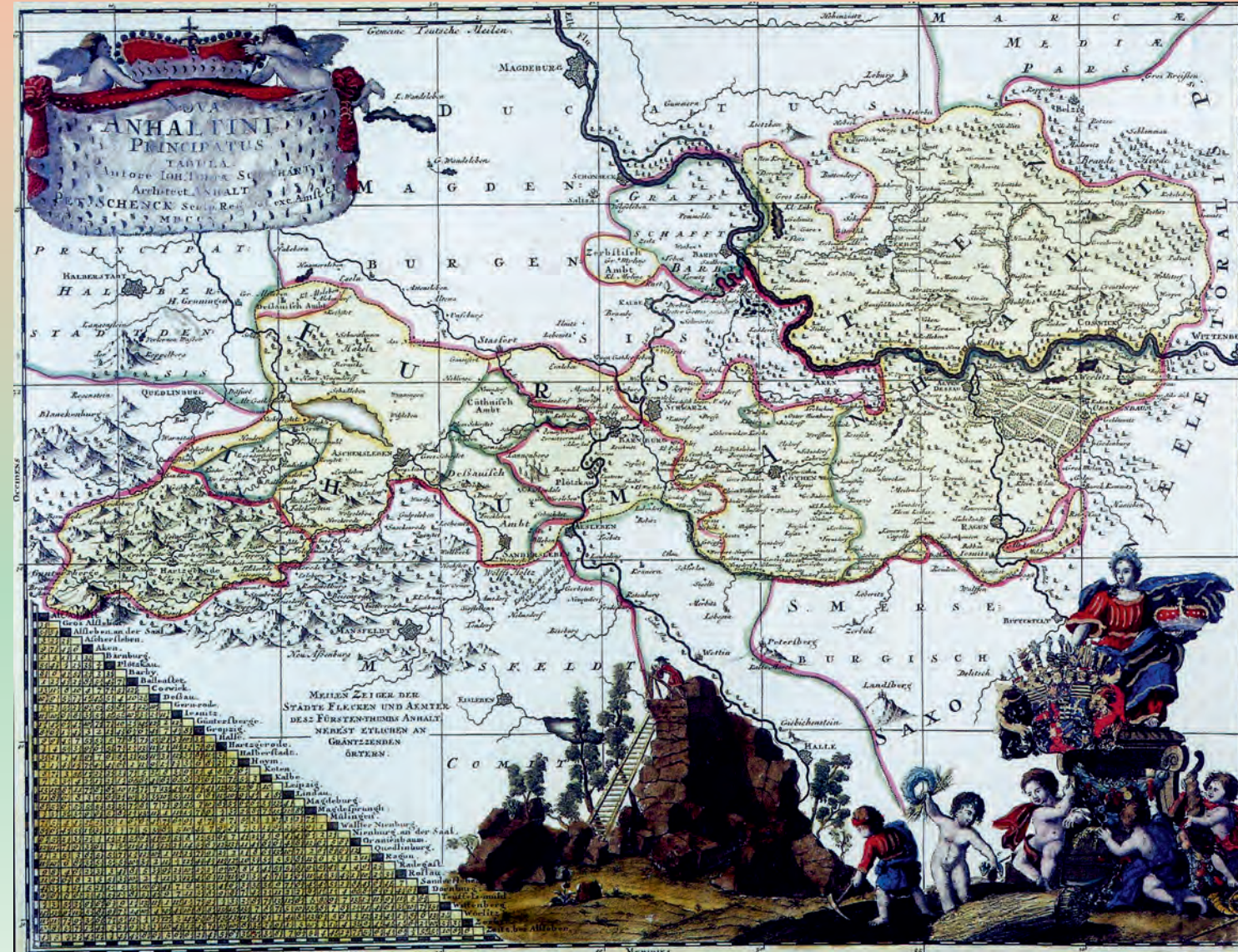
Die Grafschaft Anhalt - Karte von Peter Schenk (1710)

www.anhaltischer-heimatbund.de www.wir-sind-anhalt.de